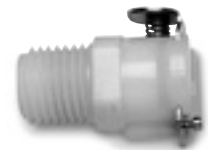
1/4" NPT带单向阀的配对接头